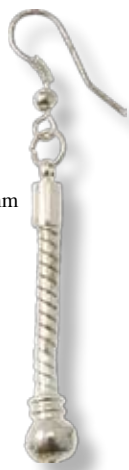
BO2GT Hauteur totale 60 mm