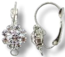
APS001 Dormeuse ø24mm