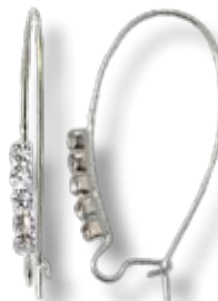
APS004 B.O fil ø35mm