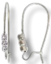
APS005 B.O fil ø27mm