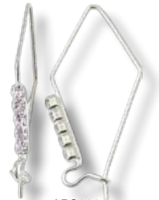
APS002 B.O fil ø37mm