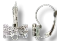
APS007 Dormeuse ø20mm