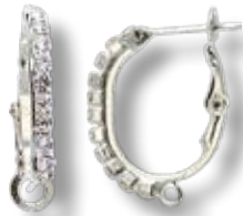
APS006 Dormeuse ø24mm