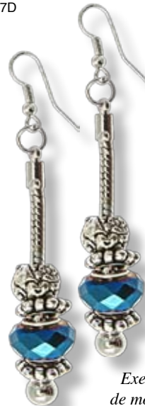
Exemple de montage

Grâce à leur grand trou, ces perles sont idéales pour être enfilées sur des cordons épais ou des chaînes. Retrouvez tous les modèles de perles à grand trou dans le chapitre « style pandora » de notre catalogue.