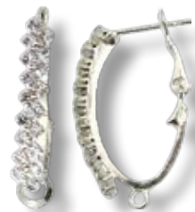
APS003 Dormeuse ø30mm