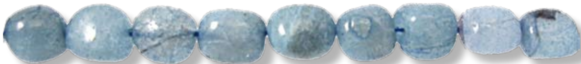
Ronde 20mm AIGR015