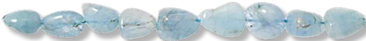
Ronde 20mm AIGR017