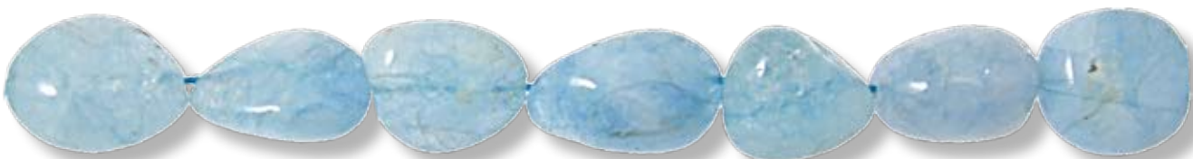
Ronde 25mm AIGR018