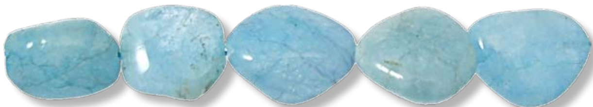
Ronde 30mm AIGR019

*En raison de la réalisation artisanale de ces perles, le nombre de pièces sur un fil ainsi que le prix unitaire de la pièce (PU) peut varier . Le nombre de perles par fil et le PU ne sont donnés ici qu'à titre indicatif.