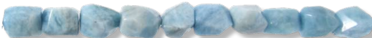
Facetté 20mm AIGR016

*En raison de la réalisation artisanale de ces perles, le nombre de pièces sur un fil ainsi que le prix unitaire de la pièce (PU) peut varier . Le nombre de perles par fil et le PU ne sont donnés ici qu'à titre indicatif.