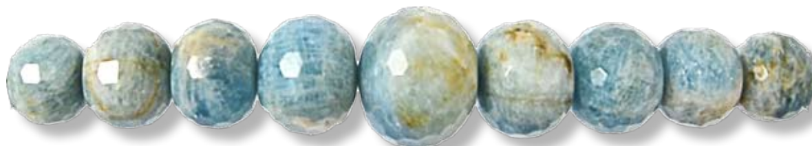
Chute facettée 42mm AIGR008

*En raison de la réalisation artisanale de ces perles, le nombre de pièces sur un fil ainsi que le prix unitaire de la pièce (PU) peut varier. Le nombre de perles par fil et le PU ne sont donnés ici qu'à titre indicatif.