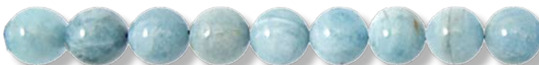
Ronde 16mm AIGR007