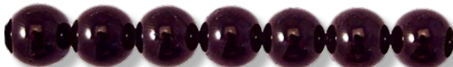
Ronde 16mm GRER007