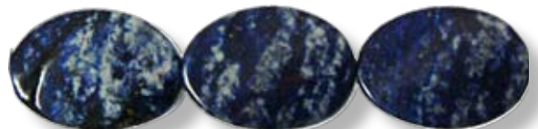
Ovale 25x18mm LAX029