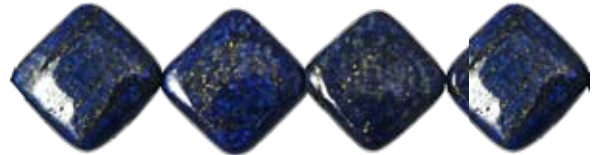
Losange 16x16mm LAX019