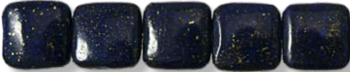
Carré 18x18mm LAX021