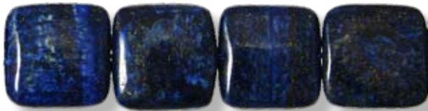
Carré 20x20mm LAX004