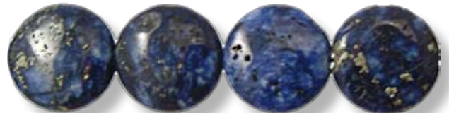
Disque ø20mm LAX006