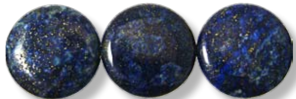
Disque ø25mm LAX008