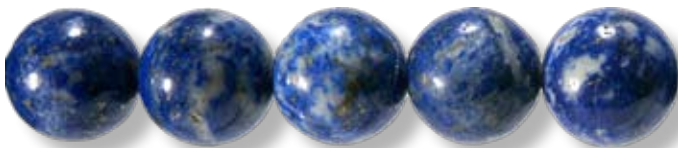
Ronde ø18mm LAX017