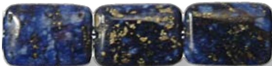
Rectangle 25x18mm LAX013