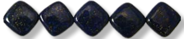
Losange 14x14mm LAX007