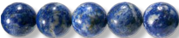
Ronde ø16mm LAX028