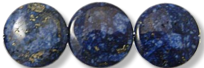
Disque ø30mm LAX005